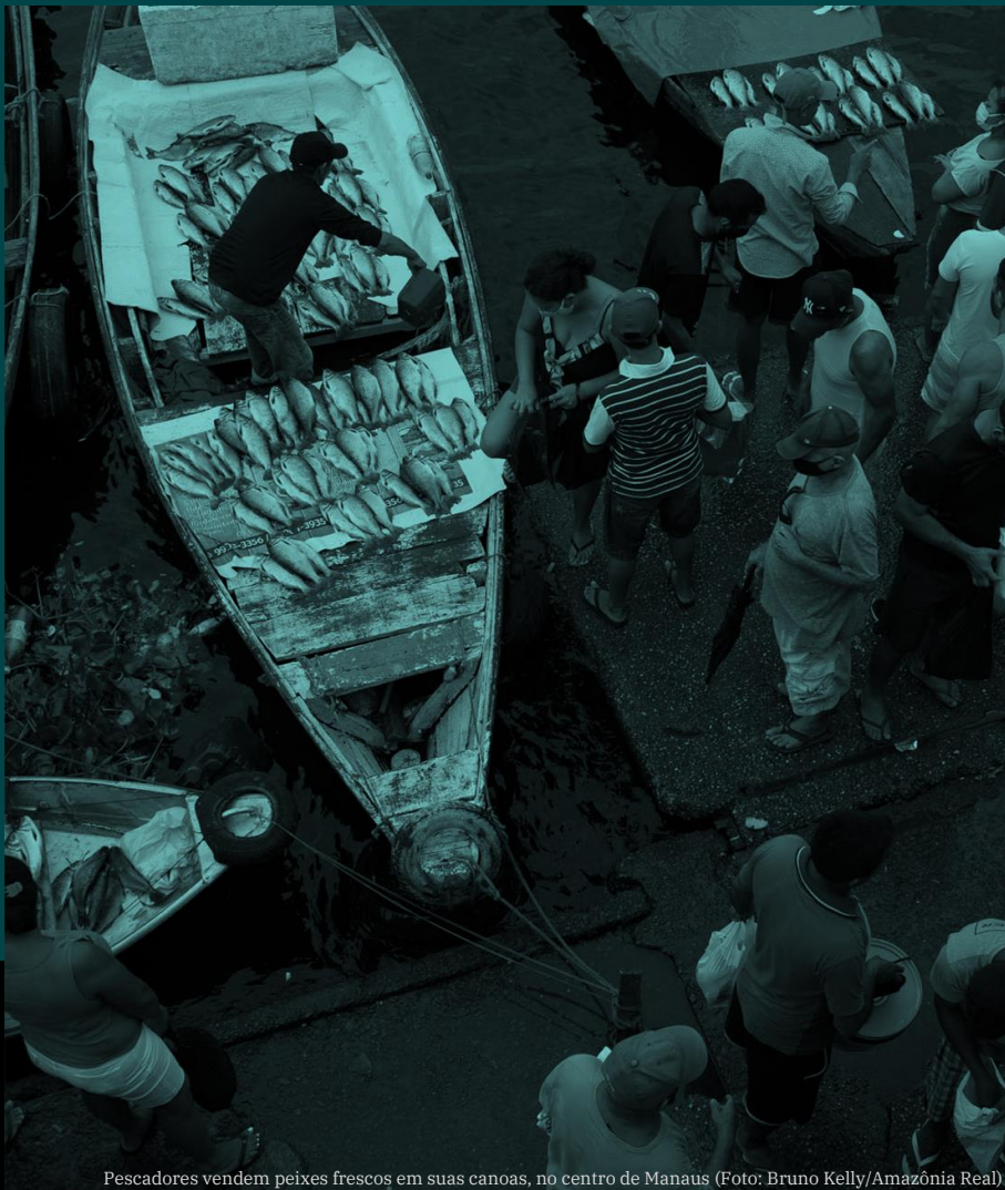
Pescadores vendem peixes frescos em suas canoas, no centro de Manaus

Impulsores e impactos de los cambios en ecosistemas acuáticos