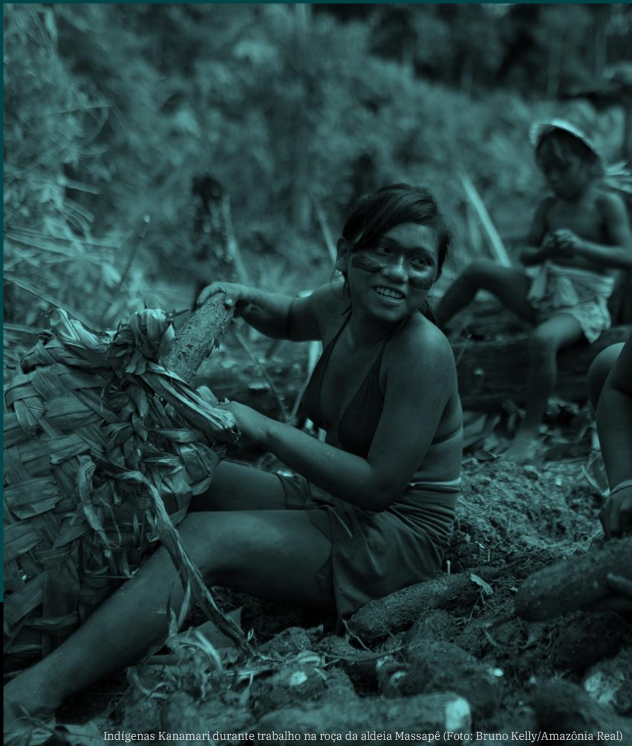
Indígenas Kanamari durante trabalho na roça da aldeia Massapé

Los pueblos de la Amazonía y la colonización europea (Siglos XVI-XVIII)