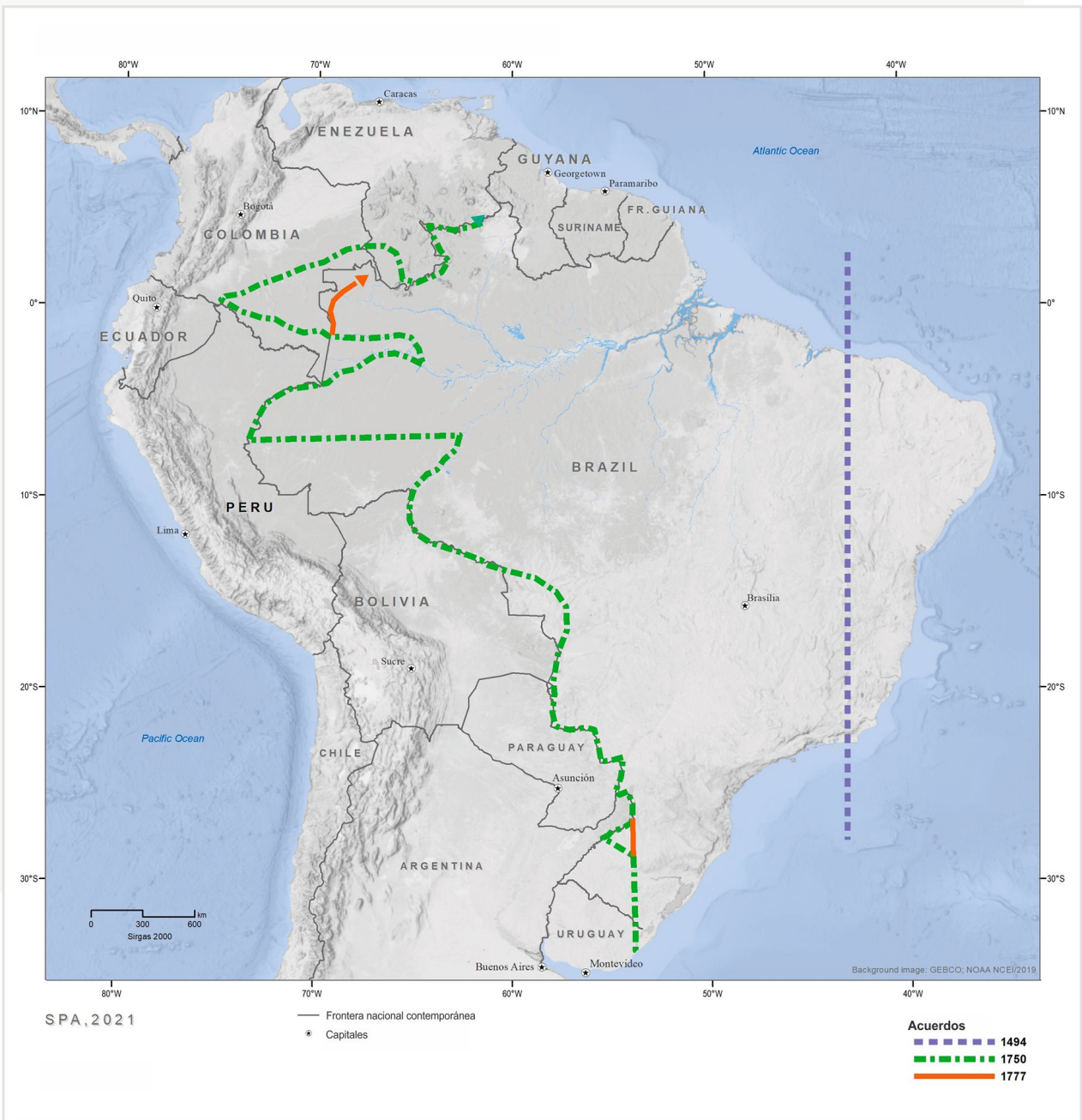
Figura 9.1 Acuerdos fronterizos entre España y Portugal. Fuente: Roux 2001 3 .

Con la conquista y los procesos posteriores de despoblación y resistencia Indígena, se perdió parte de esa conectividad. Se construyó una frontera imaginaria entre la “civilización” y el “salvajismo” o la